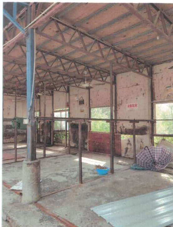
2024年9月10日闽侯生态环境局现场检查照片